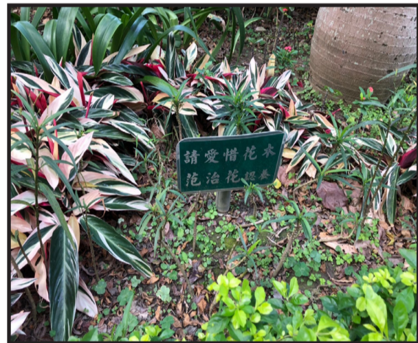
▲居民認養花木告示牌呼籲愛惜花木

大鵬華城社區改建至今將近走過二十年的歲月，當老里民談論到自己居住的社區時，無一不帶著自豪的語氣，回憶著因社區地勢特別挑高於地面，那時台北市水災時，社區得以免受馮夷之怒。又如九二一大地震後，台北不少大樓結構被震壞，而大鵬社區因樑柱及樓與樓之間距離的妥善設計，具備完善的耐震強度。里除了管委會及里長共同維護外，更需要里民具自制力維持。