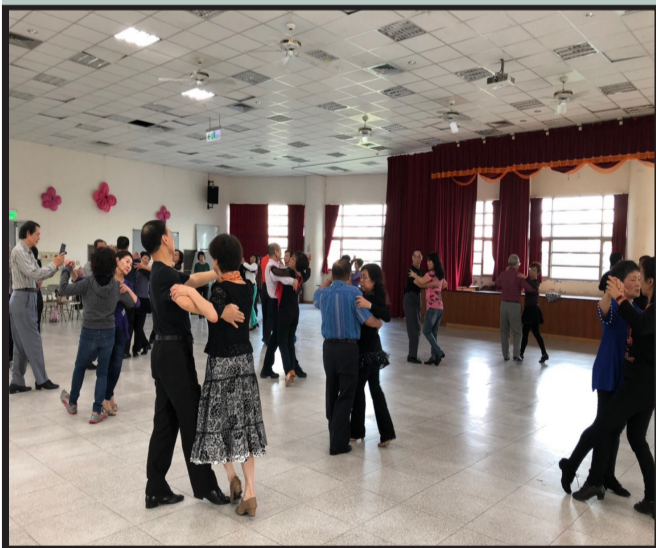
▲發展協會開設多元課程供里民參與

社區發展協會雖屬層基層的組織，但在里鄰中仍扮演重要角色，提供了可近性福利服務，更以增進居民福祉為前題，共同為自己的社區貢獻心力，努力改善居民的生活環境，提昇生活品質，促進社區的祥和美滿，強化居民的社區意識。