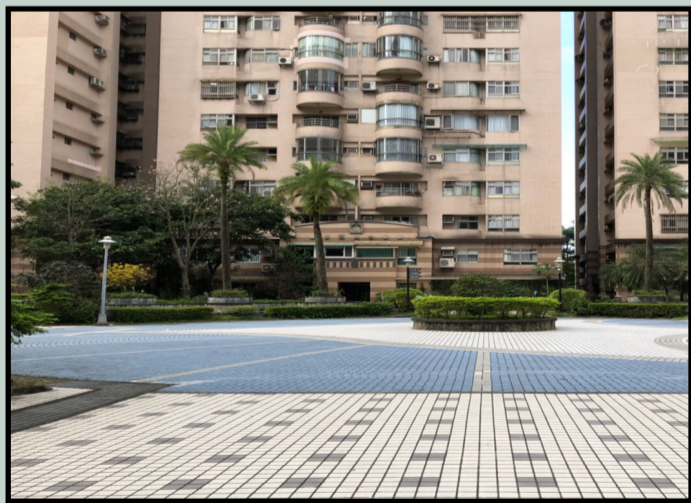
▲社區寬廣，適合老活動。

老人福利部分，除了原先在九九重陽節發放的老人津貼，同時也會積極與發展協會合作，開設老人參與課程，讓他們得以在使他們安心的環境下，互相交流。