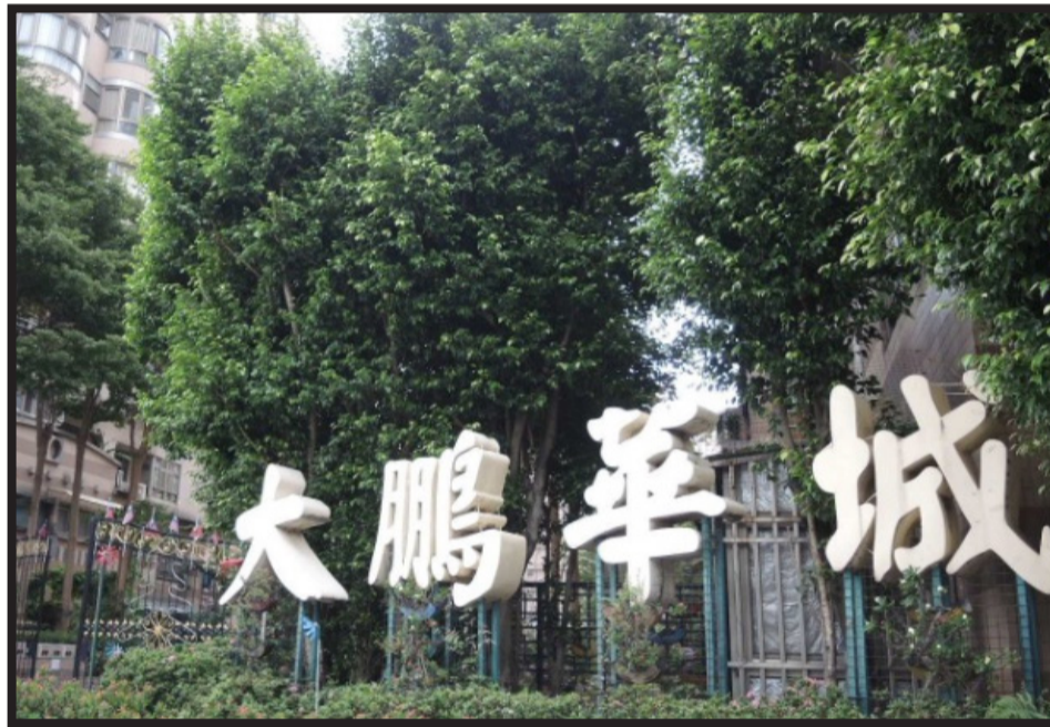
▲大鵬華城由空軍眷村改建而成，社區環境良好

如外桃源，環境佳、生活機能好，老人與小朋友都能有空曠且安全的地方活動。公共區域寬廣，設備多元，里民可自在的集會、聯絡感情。社區內同時設有志工在盡心盡力定期維護環境，例如修剪花草樹木、處理資源回收、幫忙大大小小的活動等，成為建立舒適社區環境的背後英雄。